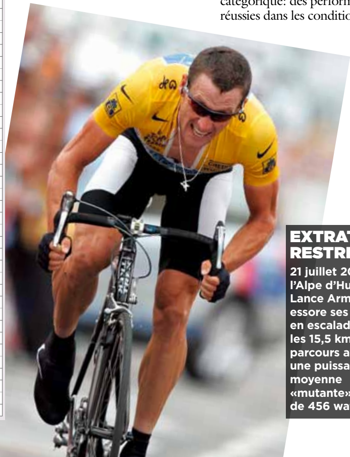
EXTRATERRESTRE 21 juillet 2004, l'Alpe d'Huez. Lance Armstrong essore ses rivaux en escaladant les 15,5 km du parcours avec une puissance moyenne «mutante» de 456 watts.

début des années 90, un outil avec des capteurs intégrés dans le pédalier, le SRM, permet de calculer cette puissance de manière directe, en prenant en compte le poids et la taille du coureur, le poids de son matériel, la surface frontale, le coefficient de roulement, le pourcentage de la pente, la densité moyenne de l'air et la topographie du parcours. Ces calculs, mon compère Frédéric Portoleau, ingénieur, les fait aussi depuis 1986 dans toutes les grandes ascensions des grandes épreuves. Depuis vingt-six ans, chaque performance a donc été disséquée et on voit clairement l'arrivée de l'EPO (érythropoïétine, une hormone augmentant le nombre de globules rouges dans le sang) au début des années 90. J'ai alors fixé trois seuils de dopage qui ne se sont jamais démentis, pour un athlète étalon de 78 kilos. Je suis catégorique: des performances réussies dans les conditions pré-